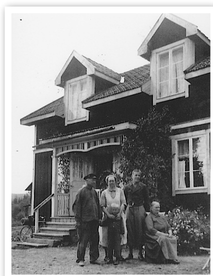
Bössmansbostället. Okänt år.