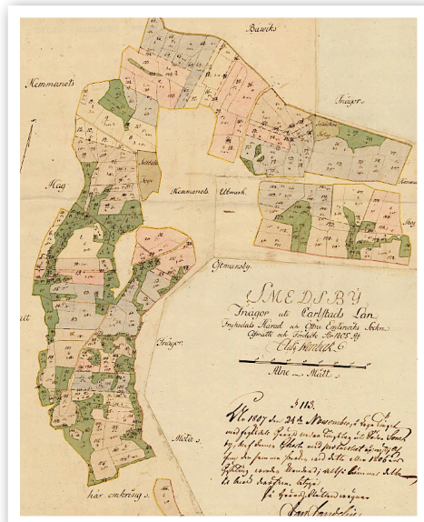
Smedsby vid storskiftet 1805