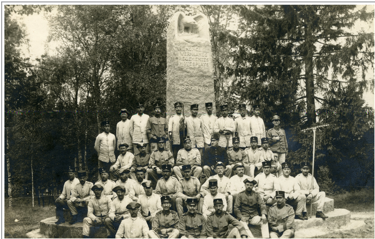
Trossnäs 1922. Gamla indelta knektar framför den 1921 resta minnesstenen (ej Bössman).

Efter avgången friköpte Bössman bostället, Bössmanstorp (Bössmanstörp) kallat, och avsöndringen utgörande 4 har 93 ar 65 m 2 fastställdes den 19/5 1915 under jordregisternummer Bogerud 1:7. [Östemtingen 1968#4].