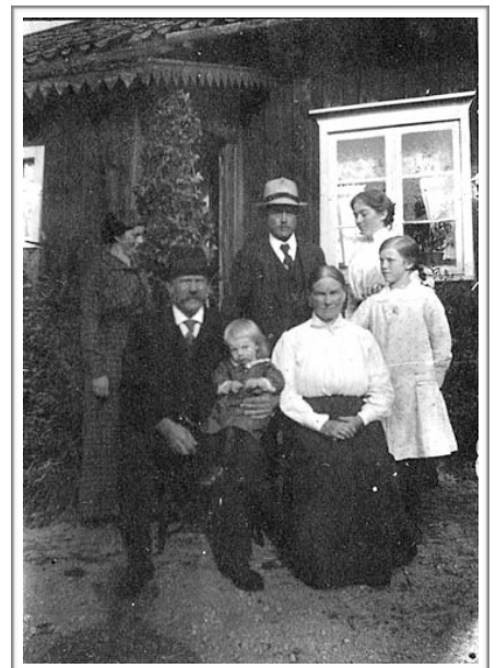
Foto: Gamla knektstugan i Bogerud före 1919. [ÖÄ HBF bildarkiv-nr: 17184_GPS007].

År 1883-95 Enligt Häradsekonomska kartan Ransäter [Hek Ransäter] ligger soldattorpet söder om Bogerudsmossen. Granne med Vistebergs och Visteruds soldattorp.