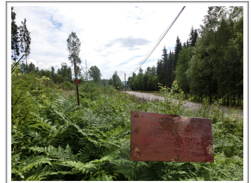
Foto: Stolpe 66 markerar positionen för Bössmanstorpet i Bössviken

Beskrivning: Lägenhetsbebyggelse, ca 50x25 m (N-S), bestående av 1 husgrund med spismursröse och 1 jordkällare. Husgrunden, i områdets N del, är ca 6x5 m st (NÖ-SV) av övermossade sällstenar. I NV är ett övermossat spismursröse, 2x2 m st och 0,5 m h. I områdets S del är en jordkällare, 8x5 m st (Ö-V). Källargropen är 2x2 m st och 0,5 m dj. I V är en 1,5 m br öppning. I SV är en synlig vall, 1,5 m br 0,5 m h. Terräng: V-sluttande moränmark. Skogsmark (blandskog). Antikvarisk kommentar: Enligt häradsekonomska kartan år 1883-95 samt Laga skifteskartan över hemmanet Bössviken år 1839 är det skogsmark i området vid de båda tidpunkterna. Kartarkiv 2: Rikets allmänna kartverks arkiv - Häradsekonomska kartan - J112-80-22/1883-95. Koordinater: N 6616449, E 403270 (SWEREF 99 TM). Lat/long: 59.674819,13.282494 (WGS84). Finns på hitta.se Östra Ämtervik 324 .